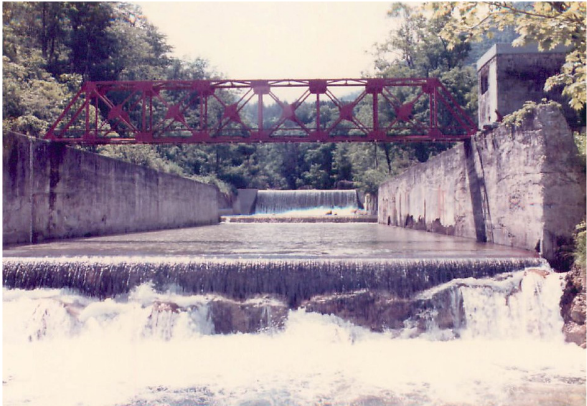
Photo 1. 本流試験流域の水路。左岸側に見えるのが水位計室。この下にある測水井へ導水し水位を観測している（1990年6月撮影）