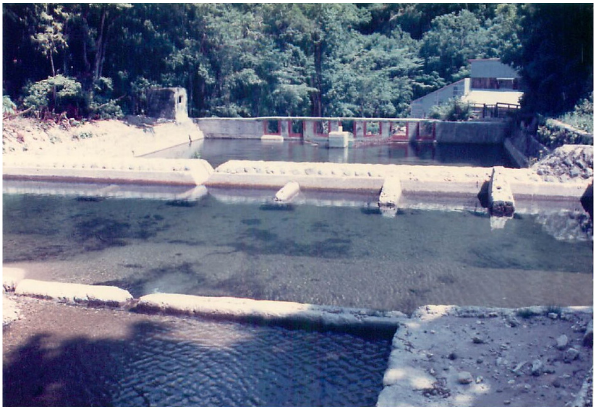
Photo 2. 上流側から見た初沢試験流域の土砂止堰堤、量水堰堤およびバザン式矩形ノッチ（1990年6月撮影）。中央の池が沈砂池、奥が湛水池