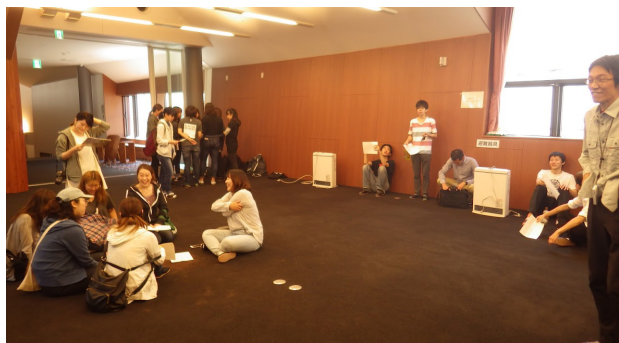
初日：集合時点 学生間に距離感がある