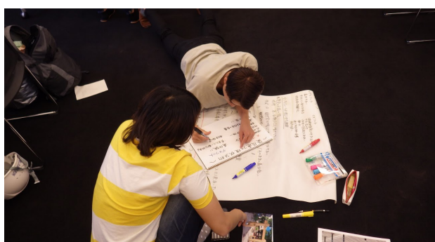
三日目：議論の取りまとめを模造紙等に整理