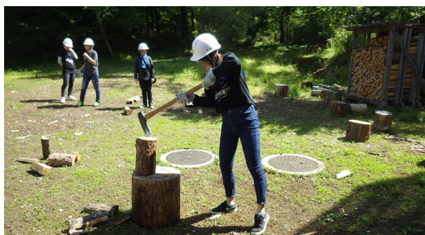
レクリエーション等によりコミュニケーションが進む