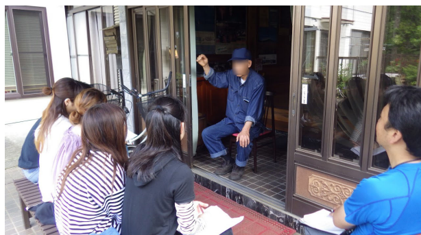
二日目：聞き取り調査（2）徐々に緊張がほぐれる