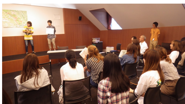
三日目：グループ毎に今回の成果を発表・共有