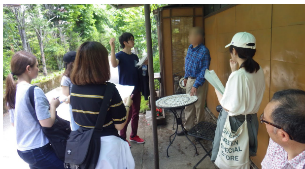
二日目：聞き取り調査（1）共同で地域住民への質疑