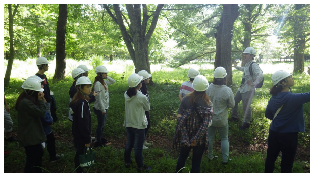
二日目：早朝 演習林内の森林見学（オリエンテーション）