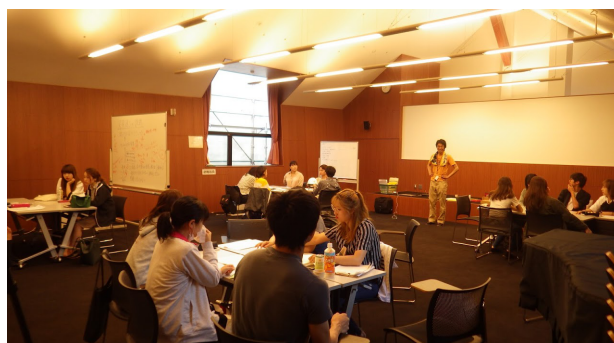
三日目：徐々に一体感をもって取り組むように